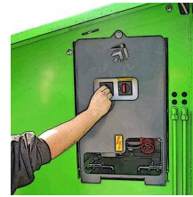
Hovedafbryder og motorværn tilgængeligt udvendigt