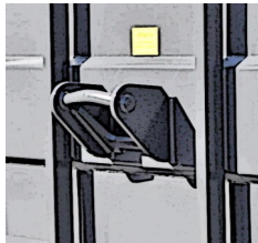
Løftekrog foran og ranger krog i bagenden er standard sammen med ruller i begge ender